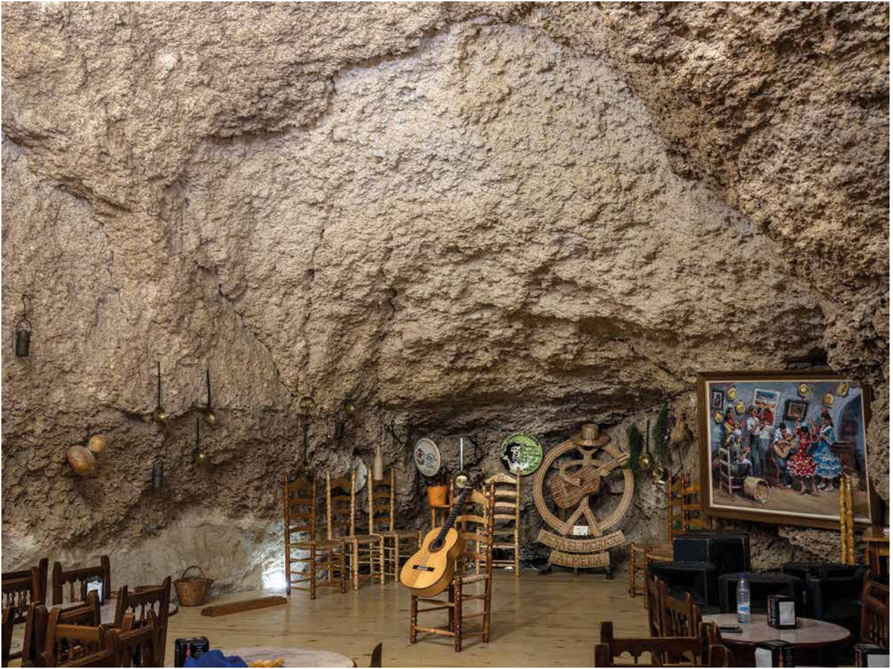
José María Mellado "Gerundina en la cueva de la Peña El Morato" Almería. 2023