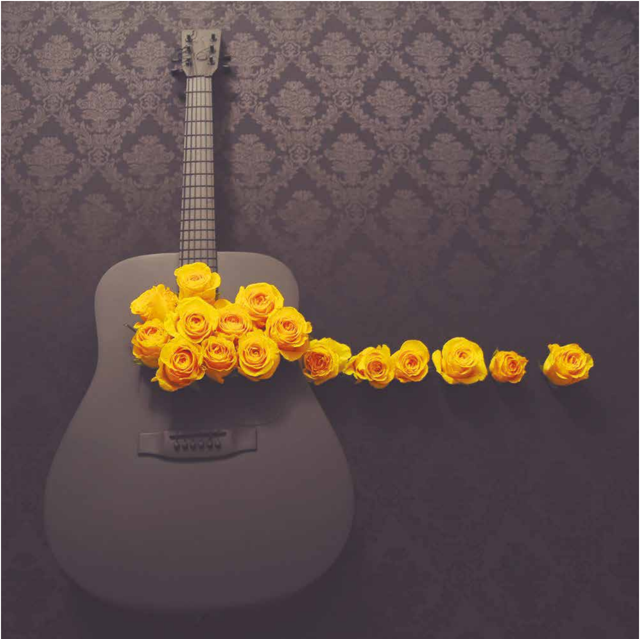
Marisa Vadillo Serie "Réquiem negro"