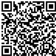
Código QR para validación en sede

Regulación CSV: Decreto 3628/2017 de 20-12-2017