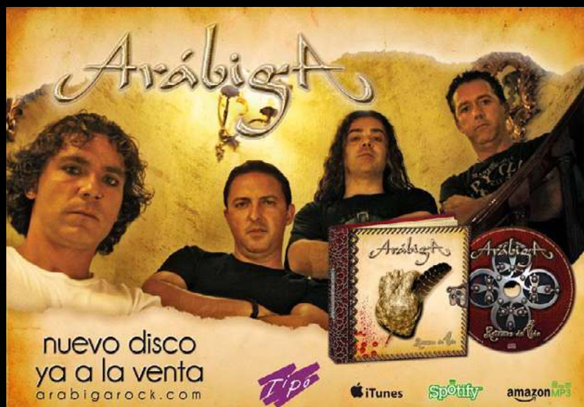
ARÁBIGA: "RETAZOS DE VIDA" (2012)