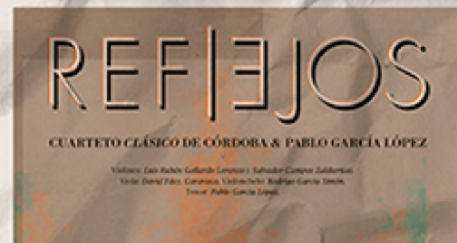
Con obras de Verdi, Puccini y Respighi