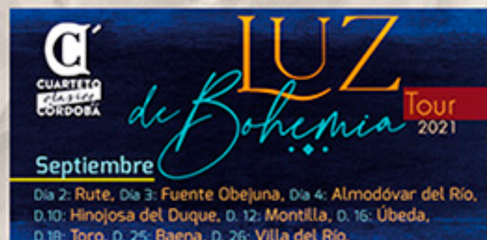
Con obras de Beethoven y Dvorak