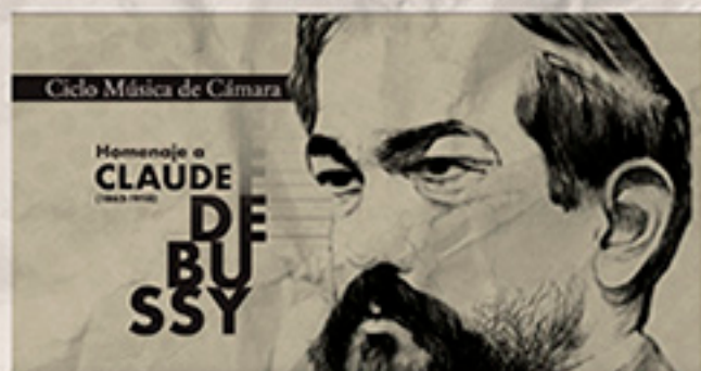
Homenaje a Debussy Eje Viena - París: Guerra y Parnaso Con obras de Schubert, Strawinsky y Debussy