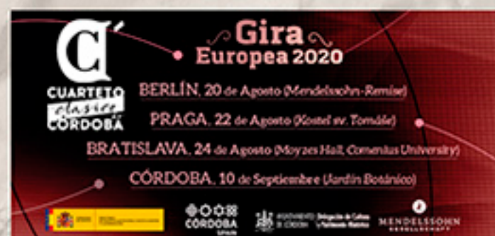
Con obras de Turina, Albéniz, Milhaud, Mendelssohn y Conrado Del Campo