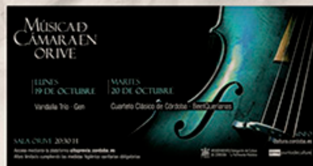
Con obras de Beethoven y Conrado del Campo