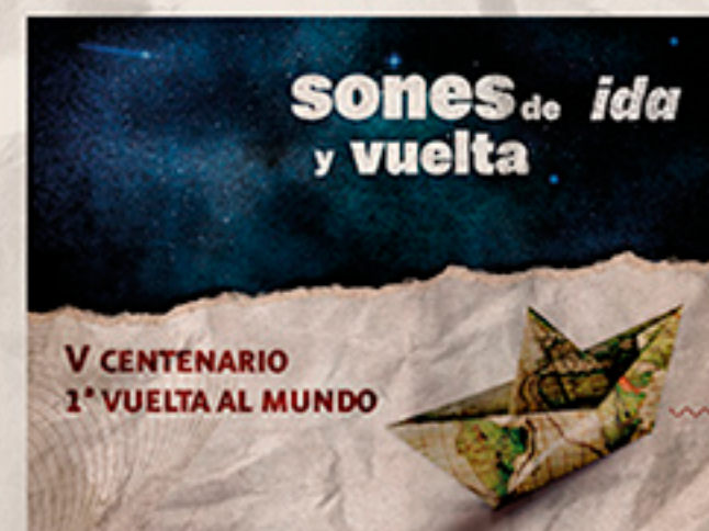
Con obras de Turina, Milhaud y Dvorak