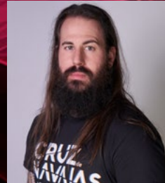
ASER LEÓN cantante y bailarín