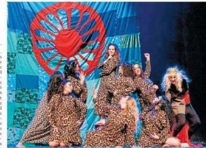
El elenco de la obra, Racistoles incluido, en el escenario. F. R.

Ahora, aquel montaje, nacido de forma honesta pero humilde, ha dado un salto que ninguna compañía granadina había dado con anterioridad, cual es su inclusión en el programa de la septuagésima edición del Festival de Teatro Clásico de Mérida, referencia absoluta del género en nuestro país. Será la primera compañía netamente granadina que figure en el programa, ya que, con anterioridad, solo el granadino José Tamayo firmó parte de la historia del ciclo. Eso sí, con letras de oro, ya que dirigió multitud de obras, desde que en 1955 comenzará, en la sexta edición, al frente del 'Julio César' de Sha-