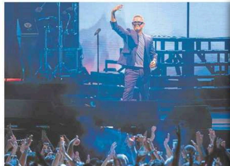
Alejandro Sanz, hasta la bandera El artista madrileño llena la Plaza de Toros de Granada con su gira 'San diez mil personas y varias generaciones unidas por su música. P38