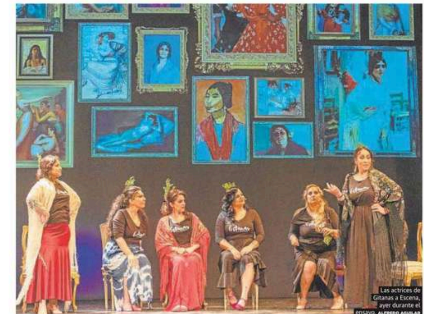
Las actrices de Gitanas a Escena, ayer durante el ensayo. ALFREDO AGUILAR