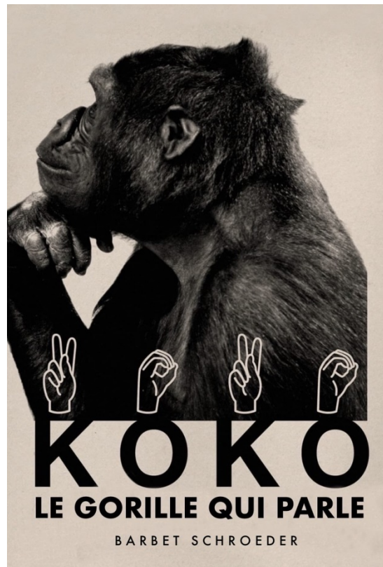
Imagen del cartel del documental “kOkO, EL GORILA QUE HABLA” (197

Koko aprendió el lenguaje de señas porque los entrenadores le ofrecieron esta alternativa, es exactamente igual que para los niños, bebé, nadie elige aprender un idioma, nosotros lo hacemos y ya está.