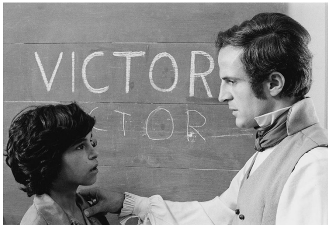
Fotograma de la película “El pequeño salvaje” (1970) de FRANÇOIS TRUFFAUT.

“El pequeño salvaje”, de Truffaut, será también una fuente de inspiración para desarrollar el proyecto. La película está basada en un hecho real que relata la historia de un niño salvaje capturado en los bosques franceses y recluido en un instituto de investigación.