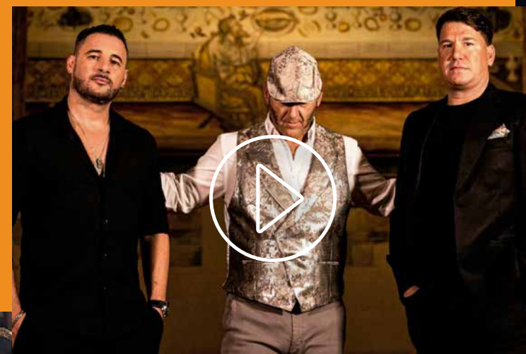
PACO CANDELA & ANDY Y LUCAS "Y EN TU VENTANA"

2022/2023 GIRA PASEO POR LO ETERNO +100 CIUDADES +200.000 ESPECTADORES + LANZAMIENTO DE UNO DE LOS DISCOS DE FLAMENCO MÁS IMPORTANTES DEL AÑO